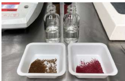
正確に計量された材料

30分後、ビーズを酸性水溶液から注意深く抽出し、フィルター処理しました。消化プロセス中のビーズの溶解を示すため、次に、ビーズを乾燥させて正確な重量を計りました。テスト目的のために、観察しやすいようにビーズをグリーンとレッドに着色しました。この検査報告は、スローリリース・コーティングのテストであり、内容物質のテストではありません。