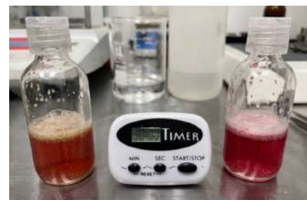
左は30分攪拌・加熱後のグリーンビーズが含まれています。右のボトルには、同じ手順を経たレッドビーズが含まれています。